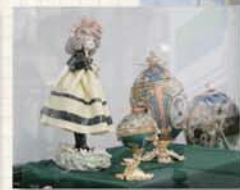
日差しが優しく差し込むエント ランスでは、講師や受講生の作 品が飾られている。