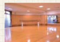
バレエ・ヨガなど、体を 動かせる講座や自然に 触れる講座も人気。 7月から新しい講座も 始まるのでお楽しみに!

「小さな教室ですが、いつも笑い声で あふれています。『何か始めてみようか な』と思ったらぜひ一度教室へお越し ください。」日常に好奇心という彩り を与えてくれる『NHK文化センター盛岡 教室』で、あなたも楽しい毎日を過ごす ヒントを見つけてみませんか?