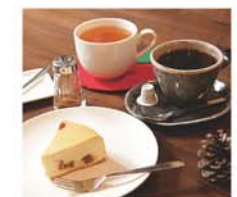
盛岡町家の雰囲気に包まれて、ゆっくりコーヒータイムが楽しめる。上からHOTりんごジュース450円、町家ブレンドコーヒー450円、キャラメルりんごチーズケーキ350円。

「時空の商店街」では三陸産和ぐるみを使ったソフトクリームが絶品。東日本大震災によって被災した人々を支援するためにスタートした「三陸の和ぐるみプロジェクト」の一環として、被災した人々が集めて殻をむいたクルミを使用し、濃厚なクルミの風味が口いっぱい広がる和風ソフト。粒状のクルミをトッピングした「プレミアムぐるみソフトクリーム」もオススメ! 備え付けの県産醤油をかけると甘じょっぱいみたらし団子のような風味に!お醤油は3種類用意しているのでぜひ食べ比べてみてね!