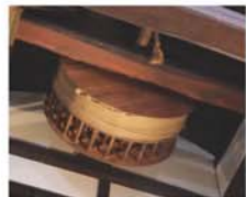
天井に設置された大きな木製の滑車。これは当時、2階へ物を上げる際に利用していたもの。200kgもある酒樽を回した縄を引っぱることで持ち上げていたそう。

旧岩手川酒造鉦屋町工場跡を活かし、盛岡の古き良き暮らしを伝える施設として昨年オープンしたばかりの『もりおか町家物語館』。「見る」「感じる」「食べる」ことができ、老若男女問わず、早くも愛される場所となっている。館内では、ゆかりの著名人を紹介する資料室や昭和の盛岡の映像を見ることが出来るスペース、また、酒蔵であったことを偲ぶせる当時の道具などが展示されている。さらに、当時の梁やガラスなどが建物の随所に残されており、地元の歴史を肌で感じることが