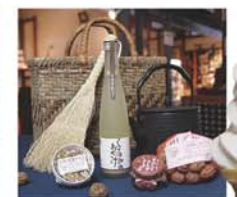
昔懐かしい風情を再現した「時空の商店街」には、岩手県産品の南部鉄器や漆器はじめ、工芸品、ぐるみ製品、沿岸地域の加工品などが数多く並ぶ。