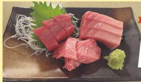
脂の乗った本鮪は、ほんのり甘く口の中でスーッととけてしまうほどの逸品。「本鮪づくし」880円

だわりぶり。素材の良さを知っているからこそ、その良さを徹底的に活かした季節の味わいをお客様にお届けしている。そして、こちらの自慢はなんとと言っても「鮪」。「本鮪づくし」は脂の乗った上質な鮪を厚切りにカットし赤身・中トロ・大トロの3種類が堪能でき、その他にも「鮪のほほ肉」や「頭肉」など他ではあまり食べることの出来ない貴重な部位も提供している。不定期で大