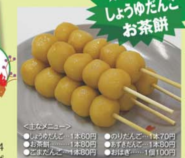
＜主なメニュー＞ ●しゅうだんご...1本60円 ●のりだんご...1本70円 ●もちだんご...1本80円 ●あずきだんご...1本80円 ●ごまだんご...1本80円 ●おはぎ...1個100円