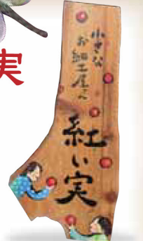
マルシロ農園に入って左にある、この看板が目印!