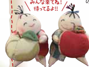
りんごを抱えた可愛いお人形や小物が所狭しと並ぶ。

マルシロ農園に隣接する『小さなお細工屋さん 紅い実』は、こちらの奥様が農作業の合間に作っているという手作り小物のお店。ちりめん細工やお人形の着物、裂き織りのバッグ、古布の創作リメイク服など心のこもった商品がいっぱい! 可愛いお人形は見るだけで心がほっこりしてしまう。「見ているだけでなく、作ってみたい!」という方にはお細工教室(要予約)も受け付けているので、気軽に相談してみてくださいね!