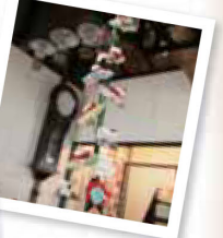
店内はまるで昭和時代にタイムスリップしたような、どこか懐かしい雰囲気、つつい長屋しやいそう...