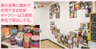
スタジオで撮影した写真。まるでモデルの様な仕上がりが、▲